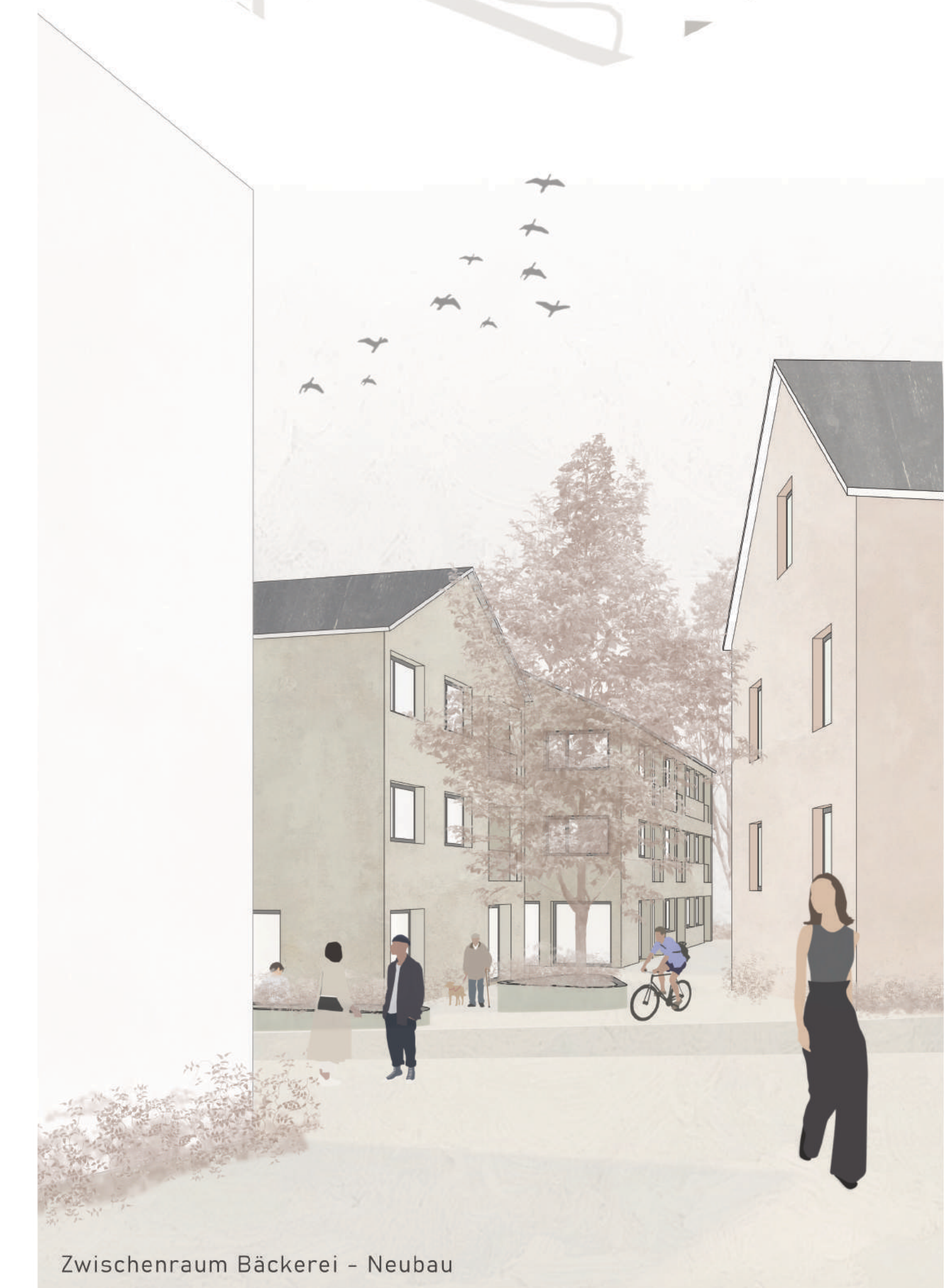
Zwischenraum Bäckerei - Neubau